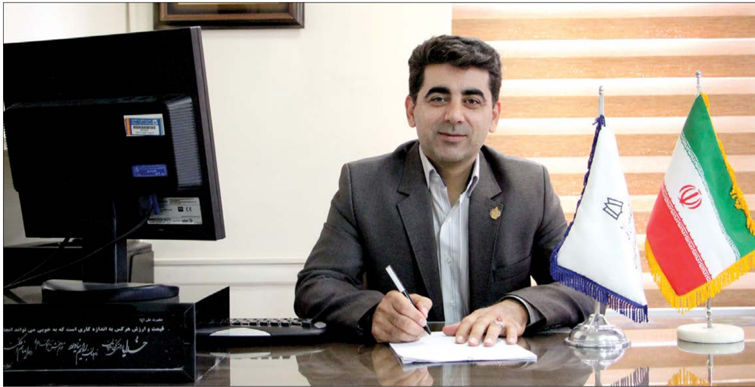
ارمغان دولت تدبیر و امید