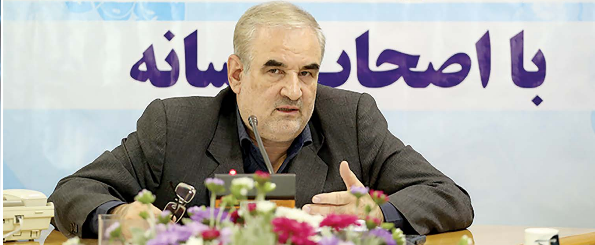
مدیرعامل شرکت مخابرات استان همدان خبر داد: