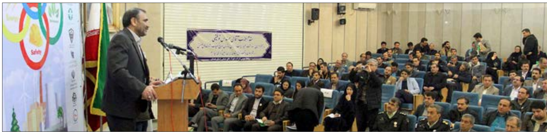
برای نخستین بار در همدان برگزار شد