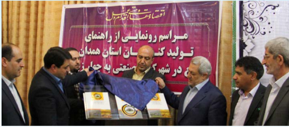
منطقه پرداختند. وی با بیان اینکه در داخل منطقه فروچاله‌ای وجود ندارد، افزود: مناطقی را که در آن احتمال ریسک وجود داشت و ممکن است در آینده به دلیل ایجاد بار سنگین بر روی آن‌ها با مشکل مواجه شویم، برای ایجاد بارهای سبک مانند فضای سبز یا پارکینگ روباز قرار دادیم.

مدیرعامل شرکت شهرک‌های صنعتی همدان با تأکید بر اینکه تدابیر لازم برای استقرار واحدهای صنعتی در منطقه ویژه اقتصادی جهان‌آباد با وجود سه مشاور اندیشیده شده، تصریح کرد: همه واحدهایی که در منطقه ویژه اقتصادی جهان‌آباد مستقر شوند، مکلف می‌شوند تا با انجام مطالعات، امکان ایجاد فروچاله را کاهش دهند. وی با بیان اینکه پس از ابلاغ سیاست‌های اقتصاد مقاومتی از سوی مقام معظم رهبری، ستاد فرماندهی اقتصاد مقاومتی برای انجام یک کاری ویژه، جهادی و بی‌وقفه مدنظر معظمله، ایجاد شد، ادامه داد: به تاسی از فرمایش‌های مقام معظم رهبری، اعتقاد داریم که ستاد فرماندهی اقتصاد مقاومتی لحظه‌ای نباید خاموش شود و به همین دلیل شش‌ماه‌روز پیگیر مسائل مختلف بر اساس تکالیفی که برای وزارتخانه مشخص شده، هستیم.